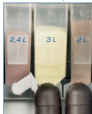
Bacs de différentes capacités

Facilité d'installation sur un socle grâce à de nouvelles prédispositions. Socle disponible en version standard (vide) ou équipée (avec réservoir eaux usées et bac de récupération des marcs). Possibilité de logement pour un lecteur de billets.