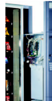
Compartiment isolé avec accès séparé au système de paiement et à l'électronique.

Le système de paiement et l'électronique sont dans un compartiment isolé avec un accès séparé, garantissant ainsi une absence totale d'humidité. De plus, lors d'interventions sur le système de paiement ou sur la programmation la température interne de la cabine ne varie pas. Snakky permet de distribuer des bouteilles PET de 0,5 L bouchon en bas sans accessoire.