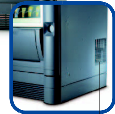
Sortie latérale d'air chaud